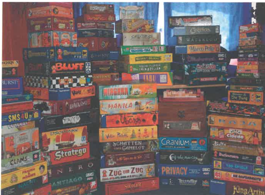
Mehr als ein Freizeitmedium: Wenn Kinder spielen, lernen sie automatisch wichtige Fähigkeiten wie Impulskontrolle, Empathie, Frustrationskompetenz.

Es liegt die Vermutung nahe, dass sich analoges und digitales Spielen gegenseitig inspirieren und stimulieren. Nicht selten finden Bücher oder/und Filme ihren Niederschlag sowohl auf dem Brett als auch digital und ergänzen sich gegenseitig sehr erfolgreich. Hörstifte